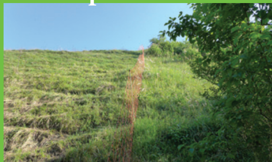
travaux de débroussaillage et pose de clôtures