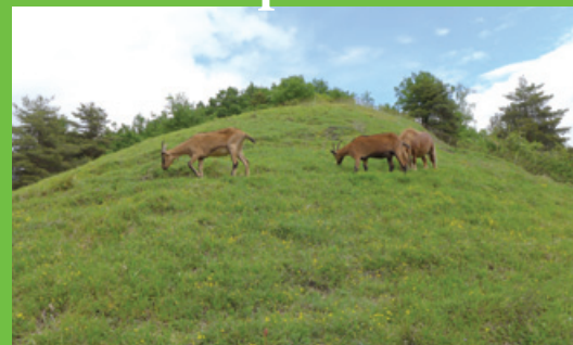
coteau préservé grâce au pâturage